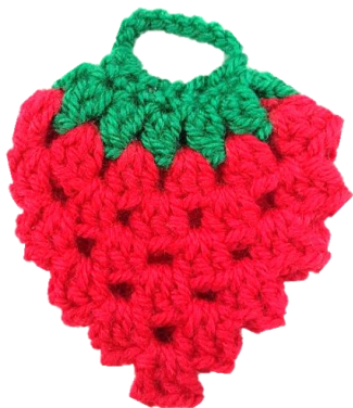
手編みのいちごクリーナー