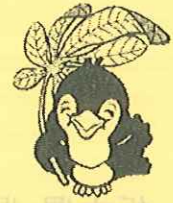
県民の日マスコット 「ルリちゃん」

栃木県は、明治6(1873)年6月15日に県が成立してから、令和5(2023)年に150年を迎えます。