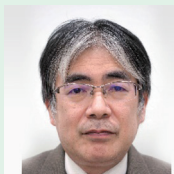
栃木県立博物館 技幹兼人文課長