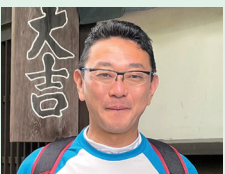
秀明大学 観光ビジネス学部准教授