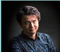
ジャズピアニスト とちぎ未来大使