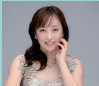
フルーティスト とちぎ未来大使