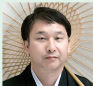
(株)大田原ツーリズム 代表取締役社長