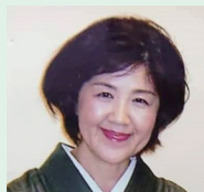
女将の会会長 日光千姫物語 女将