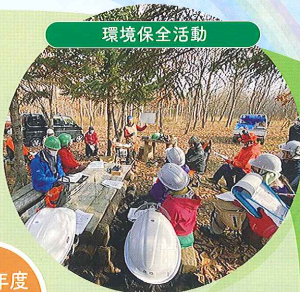
帯広の森 サポーターの会 (北海道)