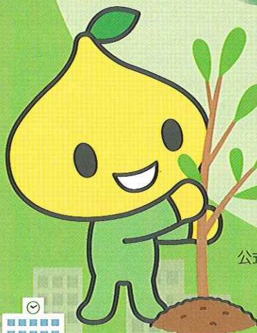
公式キャラクター ピットくん