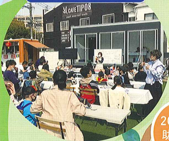
ママコミュ!ドットコム (大阪府)