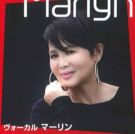
ヴォーカル マーリン