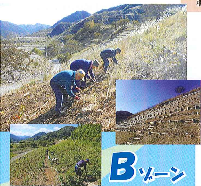
ゲート先の駐車場からほど近い久蔵口植樹地。 道沿いの植樹地で、斜面の下部に植樹します。 小学校を中心とした体験植樹が行われている場所です。