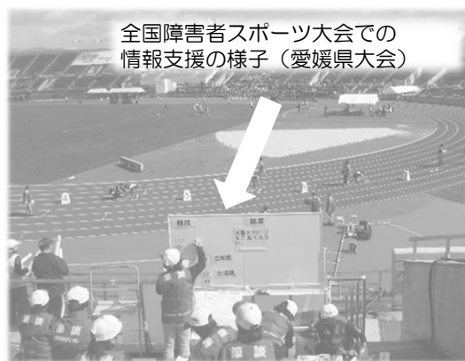
全国障害者スポーツ大会での情報支援の様子（愛媛県大会）

この機会に要約筆記者を目指し、情報支援スタッフとして一緒に大会に参加してみませんか？