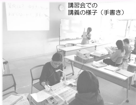
講習会での講義の様子（手書き）

音声情報を文字にして通訳することで、話の内容がわかり、会話に参加したり情報を得たりすることができます。