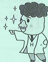
はないし博士 ※前橋市みやぎ地域づくり委員会